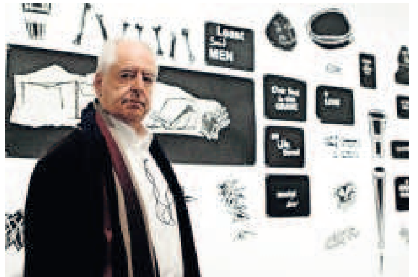
→ William Kentridge, 'associate artist' van het Holland Festival 2019.